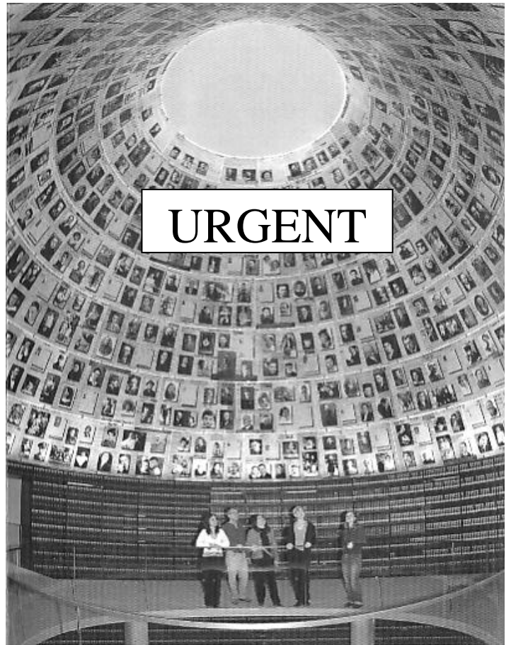
Salle des Noms, Musée d'Histoire de la Shoah Yad Vashem, Jérusalem