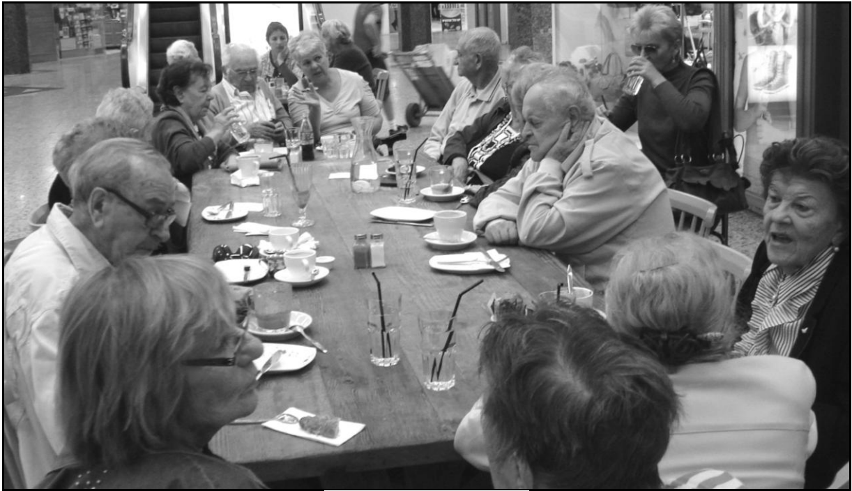
(Tel Aviv, novembre 2013)